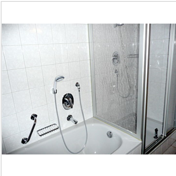
Wanne + Dusche

Zimmer: 3,50 Wohnfläche ca.: 83,00 m 2 Kaltmiete: 520,00 EUR (zzgl. Nebenkosten) Gesamtmiete: 640,00 EUR