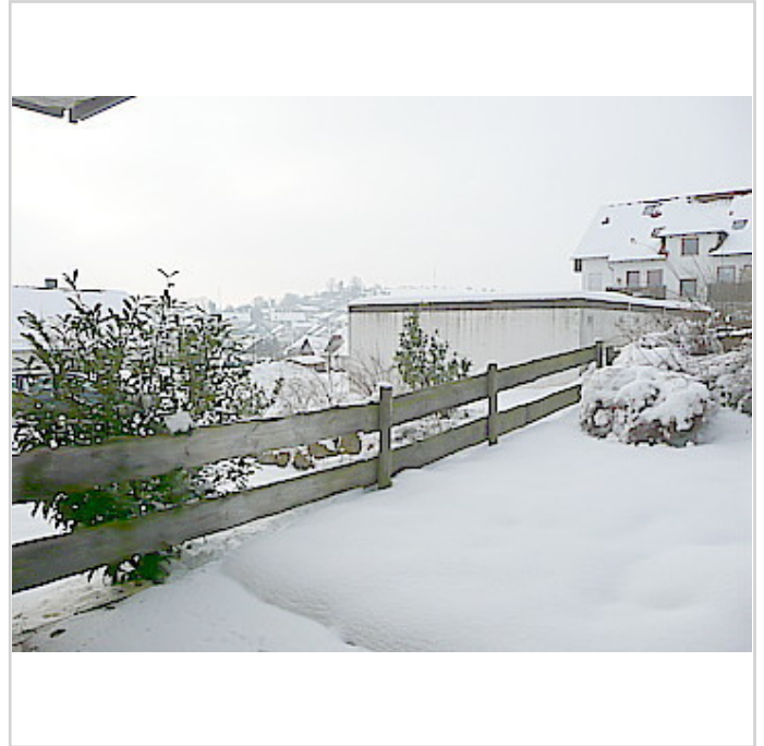
Blick von der Terrasse

Absolut ruhige Lage in einem gewachsenen Wohngebiet !