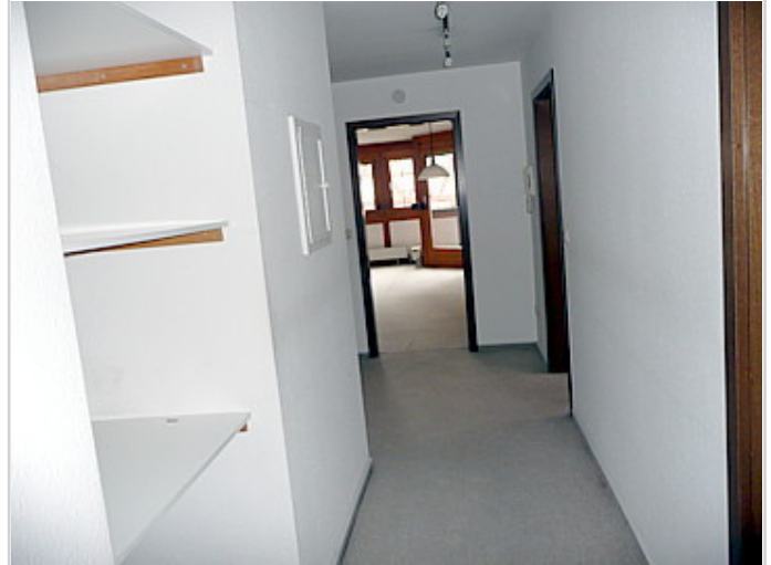
Flurbereich mit Abstellraum