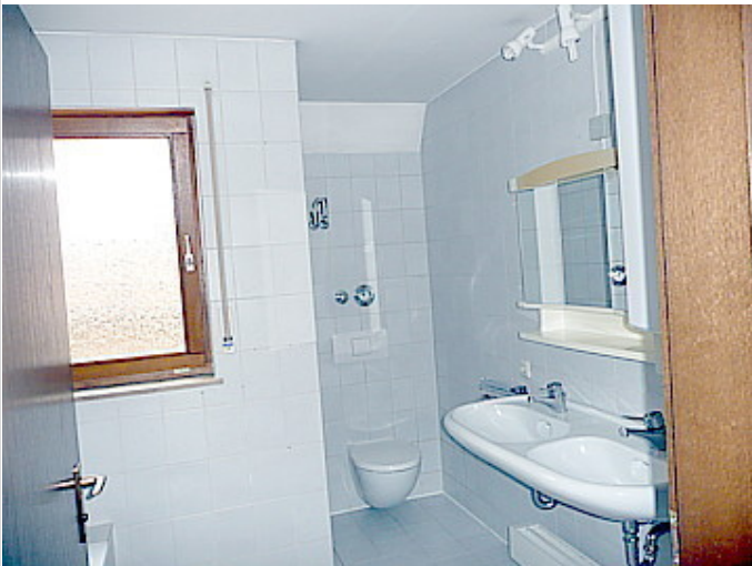
Tageslichtbad mit Wanne