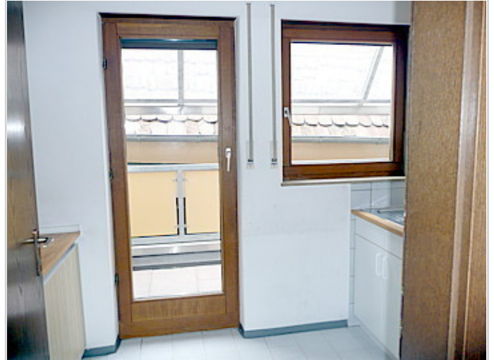
Küche mit Zugang zum Balkon